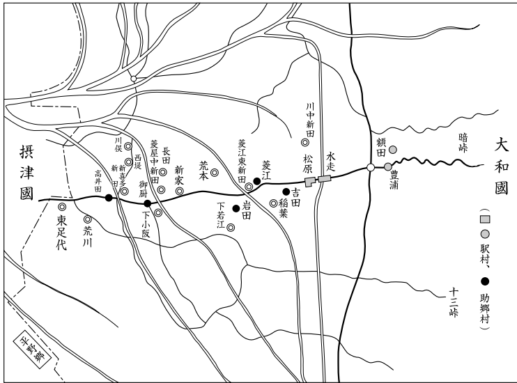
図1 奈良街道松原宿および助郷略図（『布施市史第二巻』より作成）

田・菱江・御厨・岩田・高井田の五村が松原宿助郷村に指定されることになり、「松原宿御用人馬井所入用銀高」のうち、五分四厘を元駅四力村が、四分六厘を助郷五力村が負担することになった。